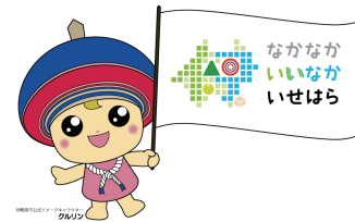
図 19 シティプロモーションマークとクルリン

豊かな自然や歴史文化といった伊勢原の魅力に関する情報を国内外へ積極的に発信することで、市の知名度や好感度を上げ、地域の活性化に向けた「シティプロモーション」を進めます。