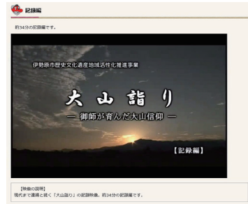
写真 117 文化財サイトの映像

財サイト」については、カラー写真や映像など、ビジュアルな情報を掲出することができ、また、英語の解説を付すことで、伝統的な日本文化に関心をもつ諸外国の人々への情報発信が可能であり、より効果的な活用が期待できます。