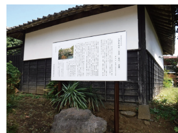
写真 116 文化財解説案内板

伊勢原の歴史や文化財の持つ魅力について、市民をはじめ多くの方々の理解を得るため、出版物の発刊、メディアへのきめ細かな情報提供、インターネットを活用した情報発信等、多様な媒体を活用した多面的な広報活動に取り組めます。特に、文化財ホームページである「いせはら文化