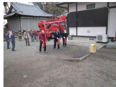
写真 115 所有者による防火訓練

市が所有する文化財に対しては、その適切な保管のため、そして有効活用を図るため、保管施設の確保、保管環境の整備に努めます。