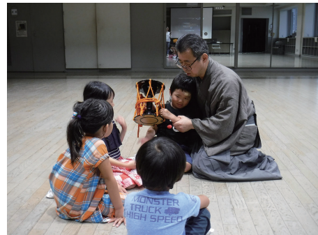
写真 119 大山能狂言親子教室

無形民俗文化財等を伝承する団体に対して、発表や公演の場や体験の機会を確保するなど、活動の支援に努めます。また、多くの方々に関心を持ってもらうような文化財の活用、特に若年層への情報提供、体験機会の創出に取り組みます。