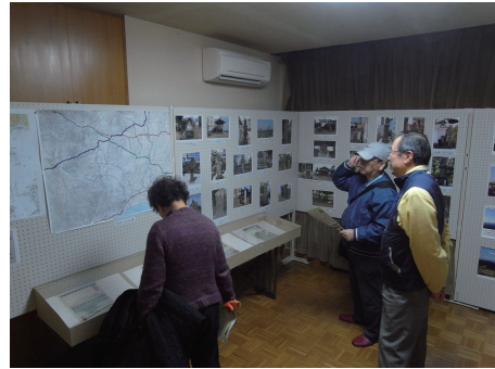
写真 118 市民団体による文化財展示

また、伊勢原市地域まちづくり推進条例に基づく市民まちづくり団体の登録指定などの制度を活用し、市民との協働によるまちづくりを促進します。