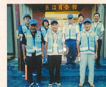
東沼目安心見守り隊

また、民生委員が地域の「つなぎ役」として、活動を通じて得る情報を関係機関（行政、社会福祉協議会、東部地域包括支援センター）と共有し、少しでも暮らしやすくなっていけば、「やって良かった」と思うことが出来ると思います。