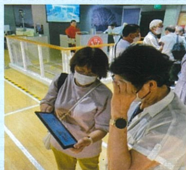
そなエリア東京体験学習