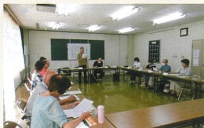
地区定例会 情報交換

自治会等への参加については任意ですが、その大切さについて日常的に語られることは多くありません。ご近所と知り合いになることや地域の活動に参加して初めて知るネットワークの大切さ、民生委員を務めてみて改めて実感しています。特に災害の多発する昨今、被災は明日の我が身、家族かもしれません。地域の皆さんが知り合いでいい関係であるということは、防災の一つでもあると思います。比々多地区民児協では各委員からの疑問や提言を話し合い、制度の手続きについても確認などをしています。情報交換を活発に、知恵を出し合って「人と人をつなぐ」安心できる地域づくりに貢献したいと思い活動しています。