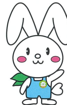
神奈川県民生委員児童委員協議会 キャラクター「みんびよん」