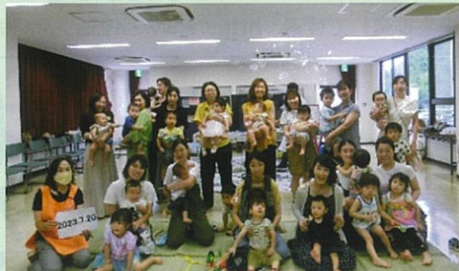
大山高部屋保育クラブ

昭和11年、高部屋村が国から「愛育村」の指定を受け母子支援事業が始まりました。酪農が盛んで携わる人々の苦労も大きく、子供たちの成長に大きな影響があった為、母子支援事業の対象になったと言われてい