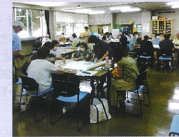
ナルミン プラン 研修風景

私たちが「住民の身近な相談相手」として、蓄積してきた相談のスキルは多岐に渡ります。そういった個別の課題を、地区全体の課題として共有していくことを目的に始まった成瀬地区民児協の「ナルミン プラン」が今年で5年目を迎えます。その間、神奈川県版活動強化方策を基に学習してきた成果もあり、気づきのポイントが広がってきたと感じられます。また、初めて対応する新任委員の悩みや心配はもちろんのことですが、委員の経験が重なるごとに悩みが増すこともあるようです。「ナルミン プラン」を通して、相談内容を可視化し整理する仕組みを身に付けるとともに、関係機関や専門職に繋ぎ、見守り続けることも改めて分かったような気がします。