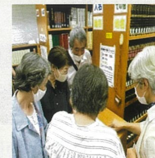
神奈川県ライトセンター

今年度は、視覚障がい者に総合的なサービスを提供する施設、神奈川県ライトセンター訪問研修に行きました。案内された女性は、全盲に近い職員の方でしたが、危なげなく館内を移動され、台所では包丁も使い、天ぷらも揚げると聞き大変驚きました。「障がいは不幸でなく不便だけ」と話され、周りの理解や協力を得ながら様々なことに挑戦されるポジティブな姿に皆感銘を受けました。