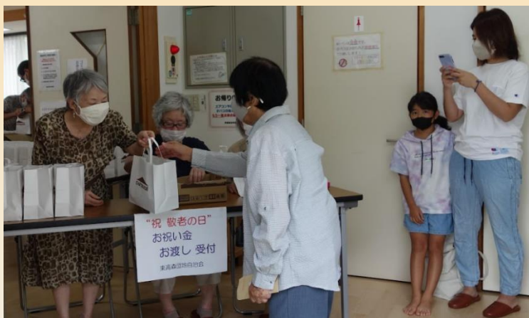
お祝い金お渡し受付の様子(東高森団地集会所洋室にて)