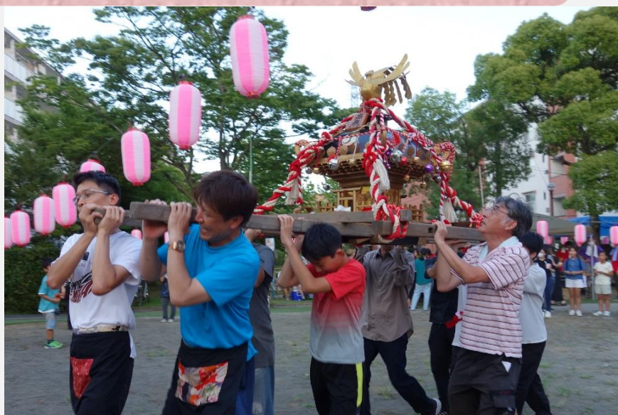
8月20日 東高森団地恒例 神輿渡御 (17号棟前広場)

盆踊りの音頭が熱帯夜の風に乗って聞こえてきます。するとあら不思議。子どもたちはゲームや屋台で大騒ぎ。大人まで飲んで踊って大はしゃぎ。それでいいのです。何てったって夏祭りですから。