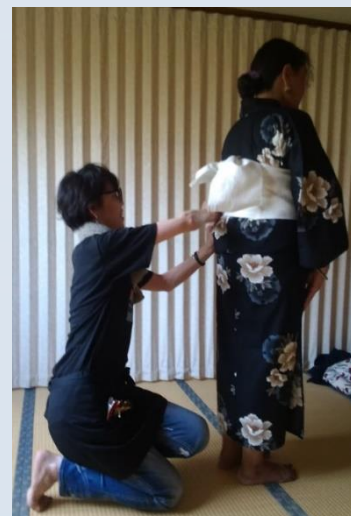
浴衣着付けの様子 (集会所和室)

2023年夏祭りの思い出がカレンダー式のすごろくになりました。夏祭りの余韻にもう一度浸っていただけたら幸いです。ご参加くださったみなさま、そして今年は参加されなかったみなさまも眺めて遊んでお楽しみいただければと思います。→次ページへ