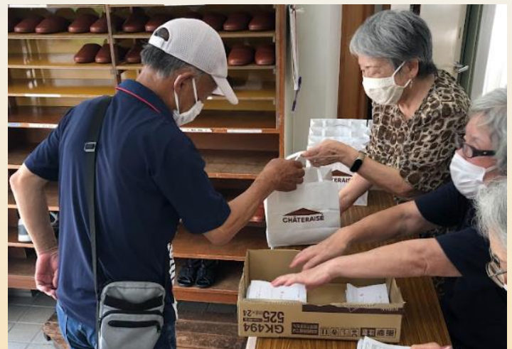
お祝いを手渡しさせていただきました おめでとうございます

お集まりいただいた143名のみなさまには、東高森団地自治会よりささやかながらお祝い金とお菓子の贈呈をさせていただきました。