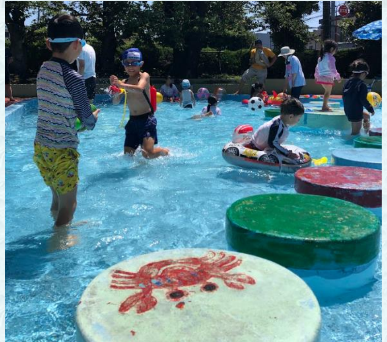
最後のジャブジャブ池イベントを思う存分楽しむ子どもたち

成熟したコミュニティだからこそ、既存の施設の未来を考えていく転機が訪れたという考え方もできます。ジャブ