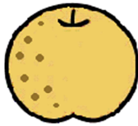
なし 1 個