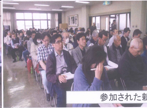
参加された新旧の組長さん