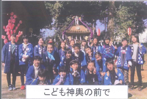
こども神輿の前で