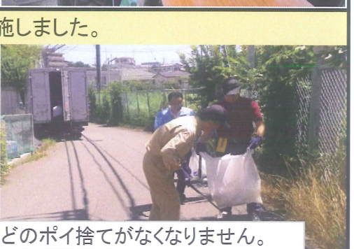
道路脇には、たばこの吸い殻などのポイ捨てがなくなりません。