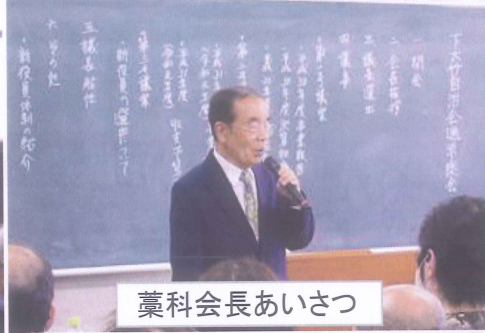
藁科会長あいさつ