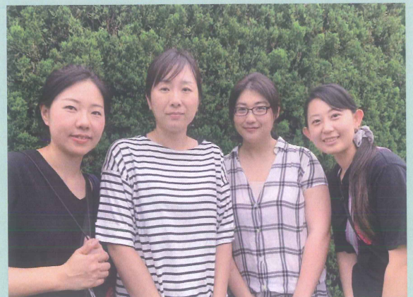
令和元年度 子供会役員一同