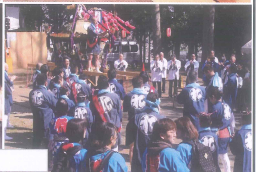
お祓いを受けてから、神輿の宮出しです。