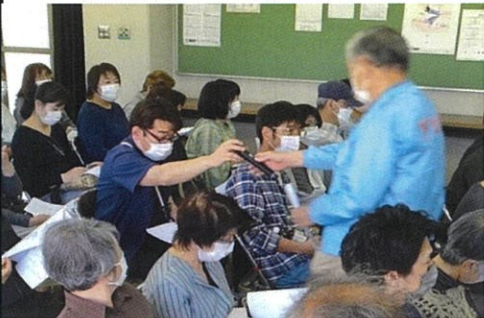
組長さんから質問も