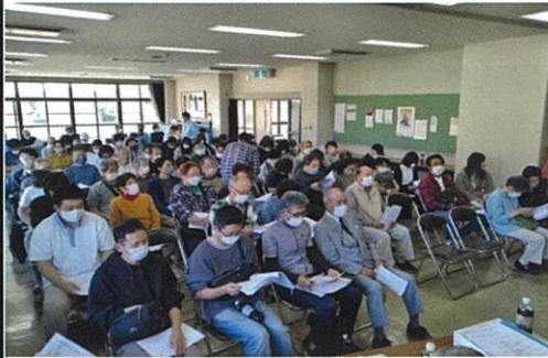
多くの組長さんが参加

新型コロナ感染防止のため、3年間組長総会は開催できませんでしたが、4年ぶりに開催されました。以前は新旧組長さん合同の会議でしたが、蜜を避けるため新組長さんだけの参加で開催しました。