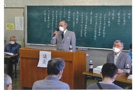
小宮議長により議事進行