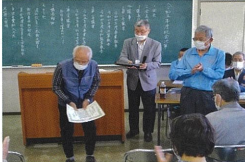
退任役員に感謝状