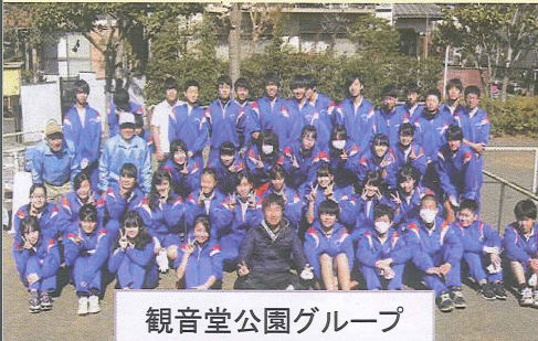
観音堂公園グループ

下大竹地域では観音堂公園と南公民館を活動拠点に道路や公園のごみ拾いを実施し、きれいな街づくりの美化活動を行いました。自治会では、この活動に協力しています。