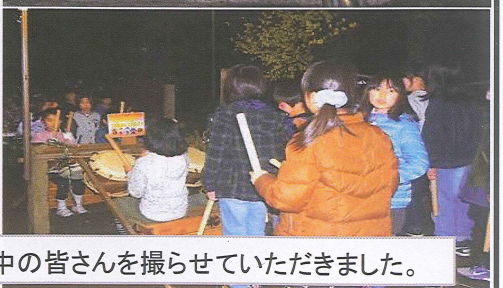
巡回の途中で、お祭りの太鼓の練習中の皆さんを撮らせていただきました。