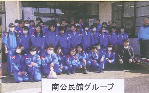
南公民館グループ