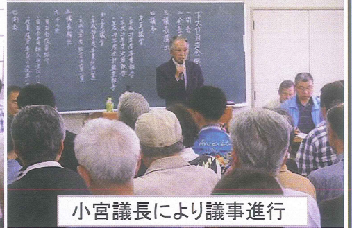
小宮議長により議事進行