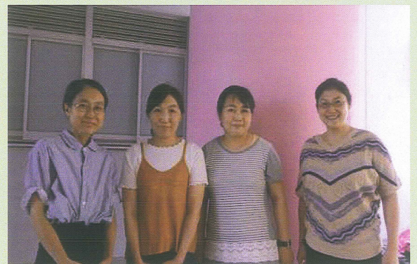
平成30年度 子ども会役員一同

これからも皆様には引き続きご指導いただくとともに、子どもたちの健やかな成長を温かくお見守り頂けますようよろしくお願いいたします。