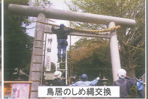
鳥居のしめ縄交換