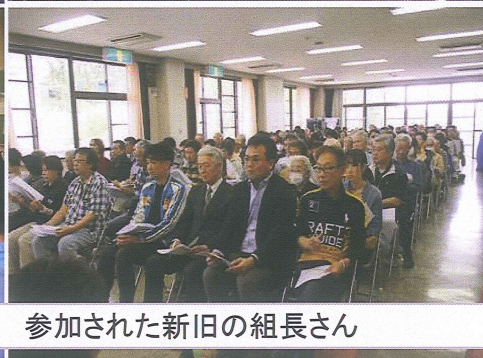
参加された新旧の組長さん