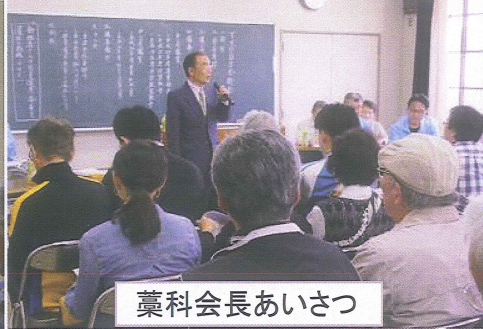
藁科会長あいさつ