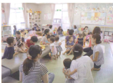
ふたごちゃんすぺしゃるデイ

主任児童委員は、0～18歳の子育てに関する支援を専門的に担当しています。子育ての悩みや心配事を地区の民生委員児童委員、児童相談所、学校、行政等と連携をしながら支援を行っています。毎月1回の連絡会で情報交換や研修等を行い、年に3回市で開催している「ふたごちゃんすぺしゃるデイ」に参加しています。