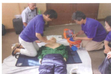
AED(自動体外式除細動器)取扱研修

今年度はさまざまな研修を行いました。具体的には、警察による暮らし安全防犯対策、人権についてのセミナー活動、心身障害者教育を理解する為に実施した静岡県