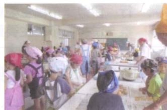
カレー作りパーティー

このパーティーに参加した児童、クラブ指導員と民生委員が皆笑顔あふれるひと時を過ごしました。