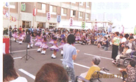
高齢者介護施設の夏祭り

具体的には、ひとり暮らし高齢者の安否確認や見守り・相談支援、加えて子どもたちの健全な生活環境の保全のために活動しています。