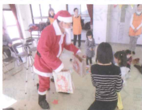
サンタクロースがやってきた！

そして、クリスマス会でサンタの登場に子どもたちは最初びっくり！サンタからプレゼントを貰うと笑顔があふれました。歌やゲームを皆で行い、楽しいひと時を過ごしました。参加者からは「企画委員は大変だけど、同世代のママと交流することで仲良くなれました」という感想も寄せられました。