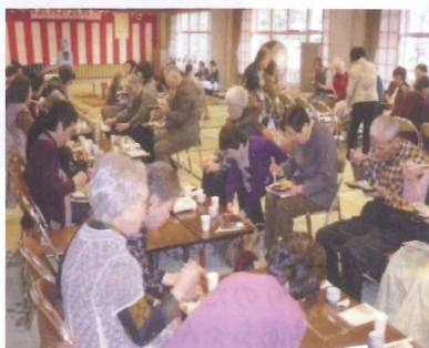
ひとり暮らし高齢者のための桜まつり