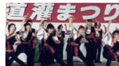
ソーレソレ! 第1回 ISEHARAソーレ大会

市民企画として開催。第40回からは商工まつりの一環としてパレードも行われています。