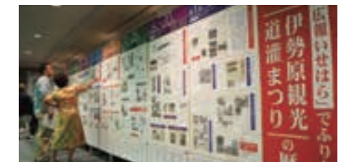
まつりの歴史を紹介する記念展示