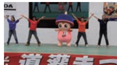
市公式イメージキャラクター クルリンがデビュー