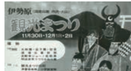
町村合併記念行事としてスタート

明治100年に当たる年に「観光まつり」として開始。道灌行列や自動車ショーを行いました。