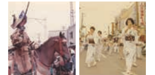
市制施行を記念し「伊勢原道灌まつり」に改称 翌年開催の第5回から、現在の名称である「伊勢原観光道灌まつり」となりました。