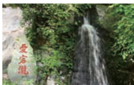
身を清めた5つの滝の一つ、愛宕滝