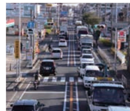
各地から大山へと向かう道は10前後のルートがあった。上/大山道の道標 下/国道246号