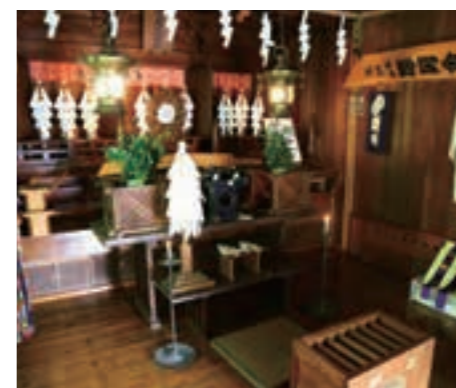
宿坊に備えられた神殿。ここで登拝する講中の無事を祈願する