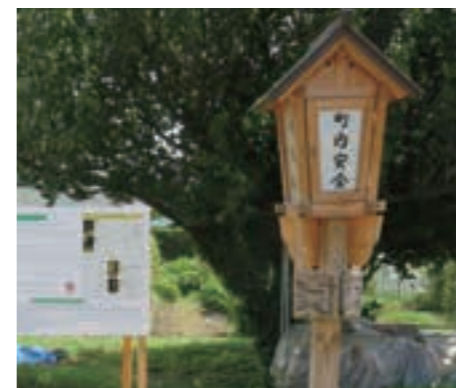
参詣者のために立てられた大山灯籠。夏山の期間中は、今も市内6カ所に立てられている