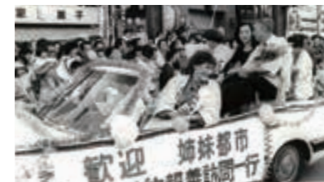
姉妹都市ラミラダ市から訪問団