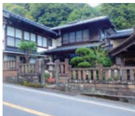
参道に立ち並ぶ宿坊。大山詣りの歴史を今に伝える、風情あるたたずまいが見て取れる

宿坊とは、一般的に寺社の宿泊施設のことで、元々は僧侶や参詣者が泊まるための施設でした。大山では御師と呼ばれる人たちが、訪れる講の人たちの安全を祈願し、宿泊の世話をしたのが始まりです。今でも大山参道に軒を連ね、昔の面影を伝えています。歴史的な建造物の中にそれぞれ神殿が設けられ、とうふなど地元の食材を生かした精進料理が楽しめるのも特長です。