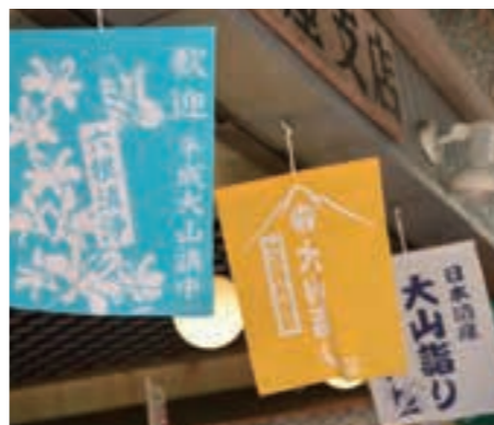
参道には訪れた人々を歓迎する「布まねぎ」が掲げられている