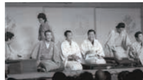
国民的番組「笑点」の収録で大盛り上がり

桜台小学校で公開収録を実施。この回の視聴率40.5%は、現在も番組の最高記録です。