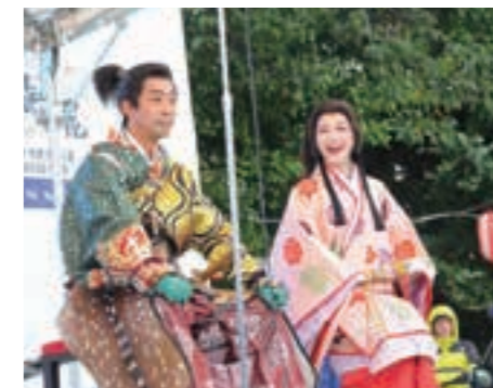
平成29年・第50回記念

市民企画として開催。第40回からは商工まつりの一環としてパレードも行われています。