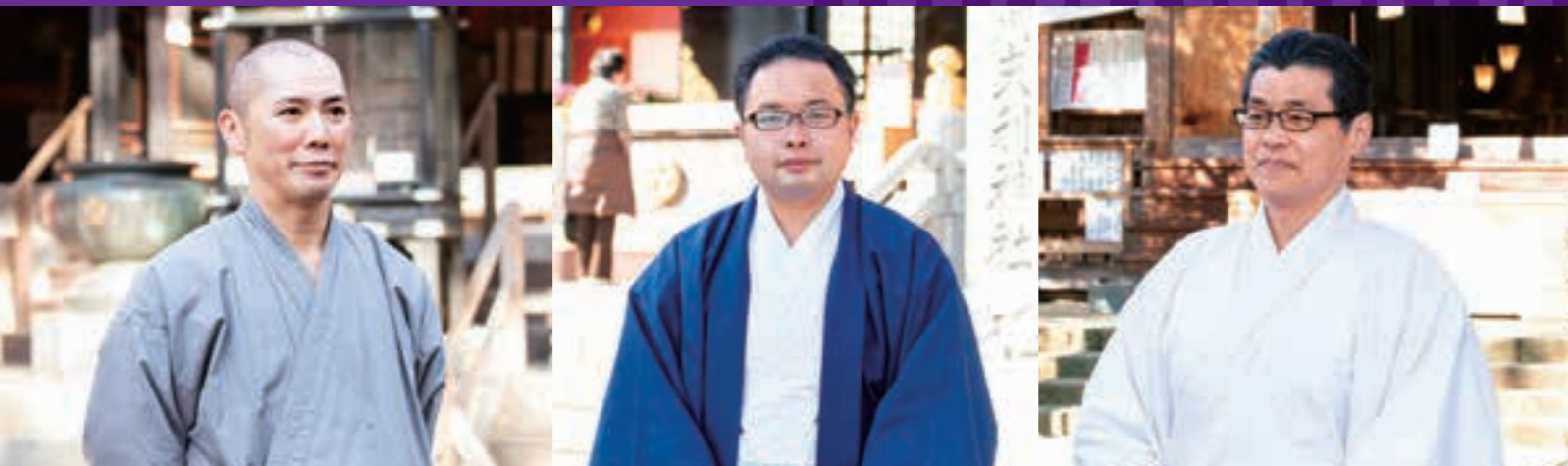
日向薬師宝城坊住職

歴史ある伊勢原の神社仏閣があゆんできた50年の変遷と未来について、日本遺産の構成文化財である社寺の皆さんにお話を伺いました。