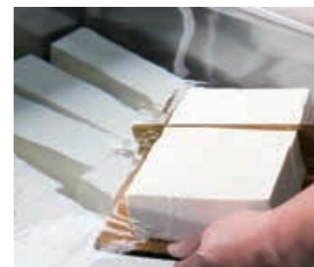
名物のとうふは、各地の講から納められた大豆と地元の清水で作られたのが始まりとされる