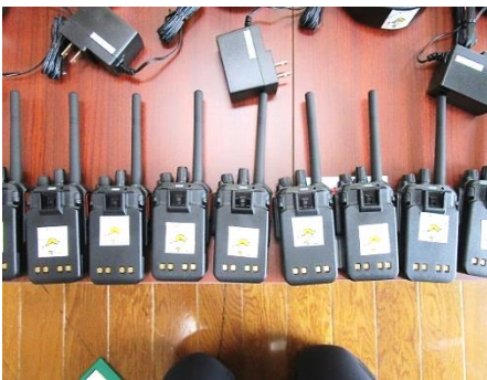
【特定小電力トランシーバー】