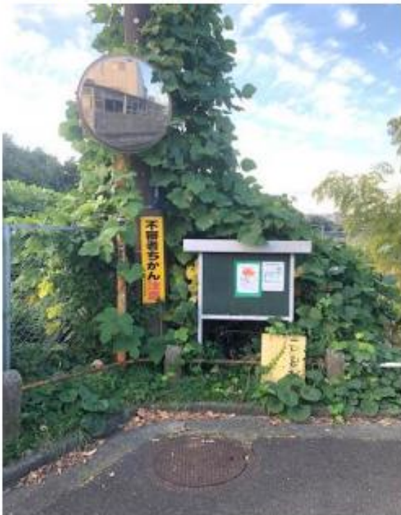
掲示板① 雑草除去前