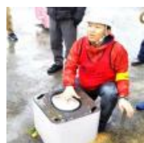
マンホールトイレ設営訓練