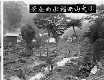
震災発生時の大山町・福永町の様子