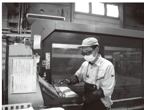
レーザーを使い鉄板を切断します