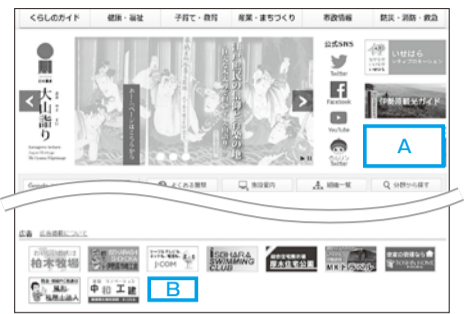
広告掲載イメージ

申し込みください。申込書は市ホームページ「申請書ダウンロード」からも入手できます◇随時受け付けています