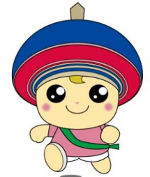
伊勢原市公式イメージキャラクター クルリン