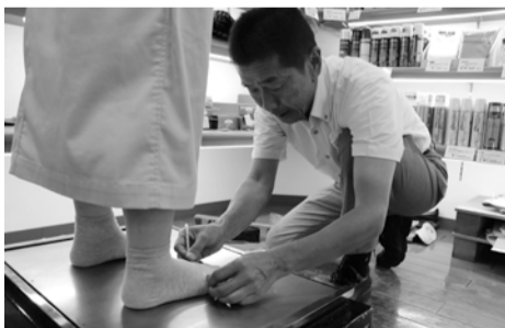
足の形を細かく計測します

対面でお話することが多い仕事なので、直接感謝されたときが一番嬉しいですね。皆さんの期待を裏切らないよう、これからも親身に寄り添ってご提案することを心掛けていきます。