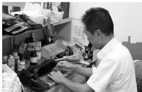
足にフィットするよう、靴のベルトを調節