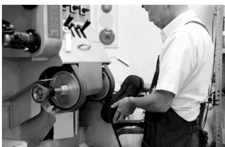
少しずつ削り、インソールを作りあげます