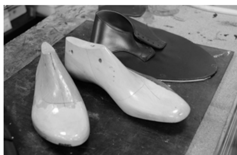
計測を基に製作した足の木型