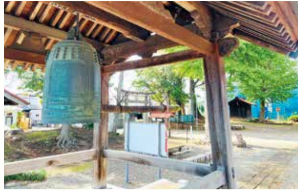
高部屋神社にある銅鐘