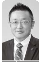
市政のデジタル化を問う

一般質問とは、本会議で議員が市政全般にわたって市長等(執行機関)に対して疑問点を質問したり、政治姿勢を明らかにしたりするものです。