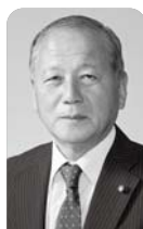
「串橋の看板」について市はなぜ対応できていないのか