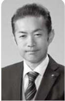
内部通報制度の導入について

いずれにしても、影響と阻害要因を整理しておく必要があることから、噴火の危険性が指摘されている火山災害について調査、研究し、万が一の事態にも市民が安心できるように備えていきたい。