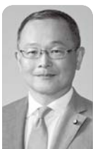
公園樹木の維持管理について