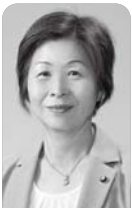
子宮頸がんワクチンの個別通知に被害者の声の掲載を