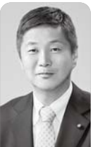
通行できる路線と通行できない路線の違いについて

【国県事業推進担当部長】 付け替え道路は、新東名高速道路事業地内に整備されていることから、将来施設管理者に引き渡