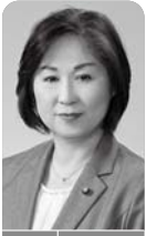
「空き家にしない「わが家」の終活ノート」の活用について