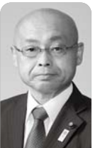
かかりつけ医が伊勢原市以外の場合について