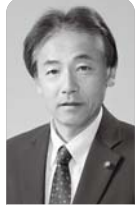
噴火災害時の消防・救急等の活動について

A 【都市部長】 本市ではシルバー人材センターが行う空き家に対する業務内容について広報、ホー