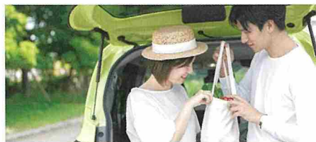
CASE | 02 夫婦で近くのスーパーまで ちょっとお買い物