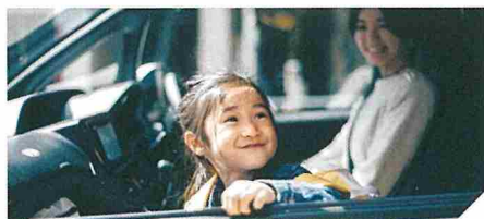
CASE | 01 子どもの習い事の送迎