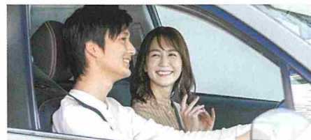
CASE | 03 カップルで 休日に近場ドライブ