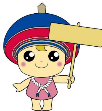
伊勢原市公式イメージキャラクター クルリン