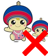
親子や友達のような使い方を しない