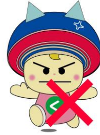
変形・改変・切除