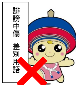
イメージを損なうような言葉 を付す