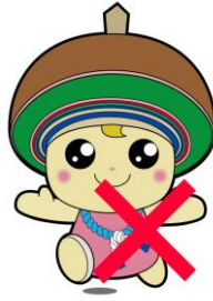
指定色以外の変更