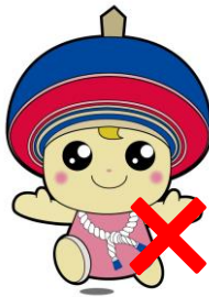
特定の個人、政党などを PR するような使い方は不可