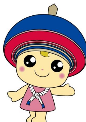
伊勢原市公式イメージキャラクター クルリン