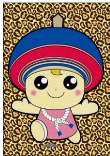
判別しにくい背景をつけない