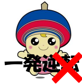
文字・イラスト等を重ねる