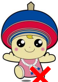
伊勢原きやら「くるくるりん」 指定の表記以外