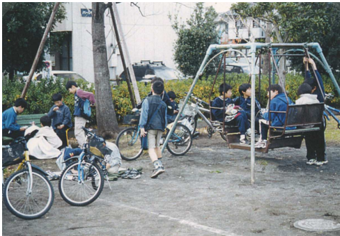
公園での遊びはカードゲーム？ 広い遊び場を望む小学生たち

配置状況についても、街区公園は標準的な誘致圏を満足して市街化区域全域をカバーしているものの、規模・内容は十分とは言えず、遊具等の老朽化も進んでいます。また、近隣公園は数的に不足しています。このことから、子どもの身近な遊び場として、街区公園の改良・改善と近隣公園の整備が課題となります。