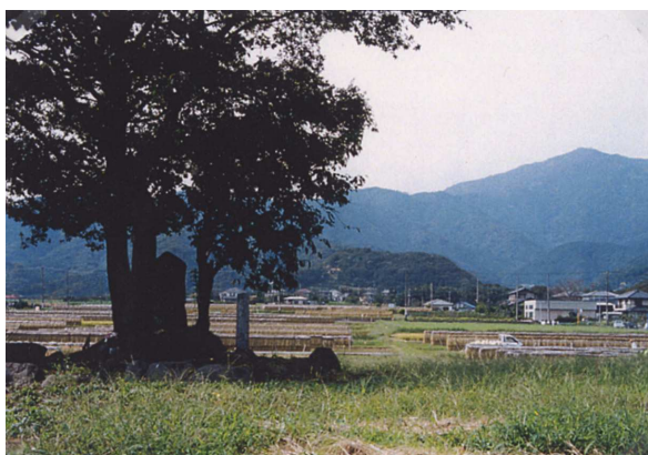
史跡とその周辺の緑

伊勢原の歴史を伝える史跡とそれを取り巻く緑は、地域における貴重な樹林地を形成し、その保全と周辺緑化に努める必要があります。また、市内に多く点在する神社等には、大径木が多く保存樹木の指定がなされていますが、維持管理に対する人手不足等の問題も抱えており、神社の境内林（鎮守の森）と周辺の緑の保全に努めることが課題となります。