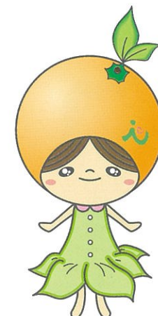
伊勢原協同病院キャラクター れんみ