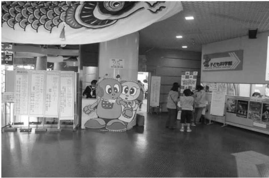
子ども科学館 (ピコ・ピピ)