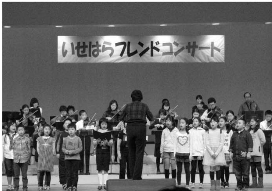
いせはらフレンドコンサート