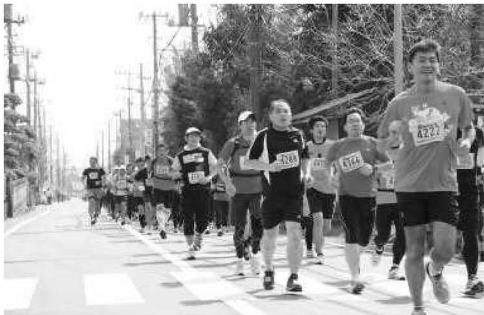
大山登山マラソン大会