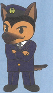
少年育成課マスコット ジャンパード警部

一緒にプレイをしたりゲームで知り合った人とチャットをしたりしていると、仲間意識が芽生えてくるかもしれません。その仲間意識や信頼感を悪用してあなたを闇バイトの世界に引きずり込もうとする人や、性的な画像を送らせようとする人、わいせつな行為をしようとする人がいます。安易に個人情報を渡さない・アルバイト案件に興味を示さない、会いに行かないことが大切です。