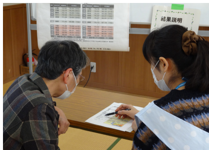
令和2年度「健康バス」の様子