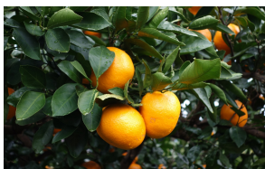
みかん園内のみかん