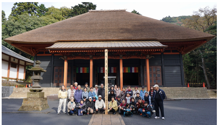
宝城坊本堂前にて