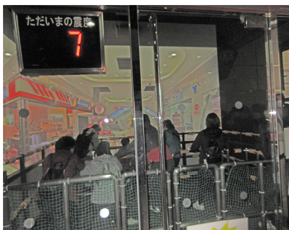
〈震度7は立ってられなかったです〉

2月15日(日)に厚木市下津古久の神奈川県総合防災センター見学会に行ってきました。参加者は自治会理事を含めて36名。子どもたちも4名参加してくれました。地震体験や風水害体験など普段経験できないことを体験出来ました。これを機会に防災意識の更なる向上を目指したいと思います。