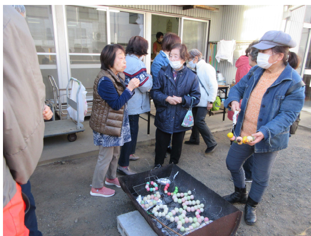
〈おだんごおいしく焼けたかな〉

どんど焼き終了後、自治会の各団体役員及び組長さんとの新年顔合わせ会を行いました。