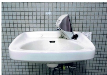
自動水栓工事完成