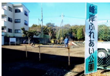
峰岸ふれあい公園

令和4年1月14日(金曜日)峰岸ふれあい公園の広場で峰岸上・下自治会共催の「お焚き上げ」を行いました。今年も新型コロナウイルス感染症の拡大が止まらないことから、「お焚き上げ」のみを自治会役員で行いました。昨年と同様に正月飾りなどを焚き上げ、新型コロナウイルス感染症の撲滅と無病息災を願いました。