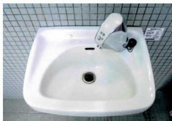
自動水栓工事完成