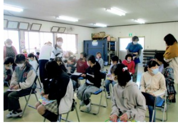
お絵描き伝言ゲーム1