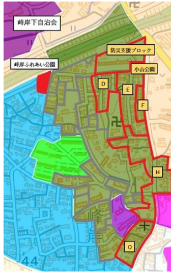
防災支援ブロック図

小山公園は令和4年2月6日(日曜日)9時～12時に実施される自治会自主防災会の防災訓練には、地元消防団の消防車両が待機、出勤等の拠点となる予定です。自治会のみなさん防災訓練当日は安否確認カードの掲示にご協力願います。