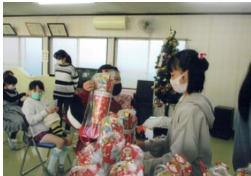
クリスマスプレゼント