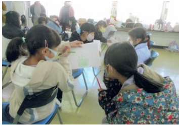
お絵描き伝言ゲーム2