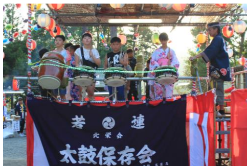
子ども達による迎え太鼓