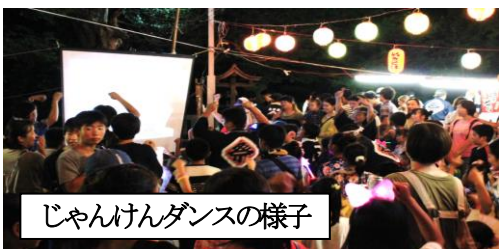
じゃんけんダンスの様子

二か月以上前からの準備と当日の運営に携わっていただいた、長寿会、北栄会、消防団、子ども会、地区委員、各種団体の役員、自治会前役員、盆踊り大会協力員、そして、資金協力をいただいた方、大会に参加された自治会員の方等々、大勢の皆さんに紙面をお借りして、あらためて感謝を申し上げます。来年も是非、多くの皆さんの参加をお待ちしています。