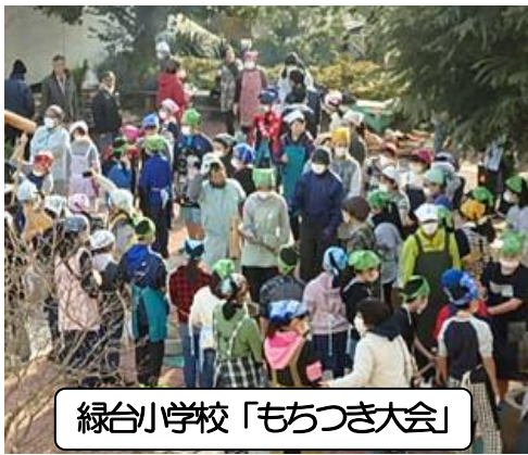
緑台小学校「もちつき大会」