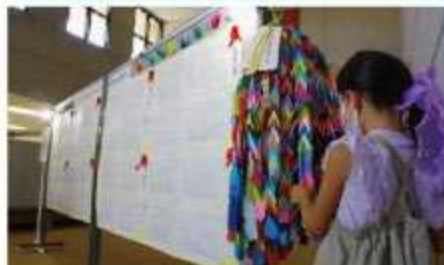
令和4年8月26・27日 伊勢原市平和を祈念するパネル展示にて