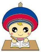
伊勢原市公式イメージキャラクター クルリン