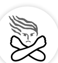
女性に対する暴力根絶のためのシンボルマーク

とき 11月18日(月)~24日(日)の午前8時30分~午後7時(土・日曜日、祝日は午前10時~午後5時)