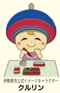
伊勢原市公式イメージキャラクター クルリン