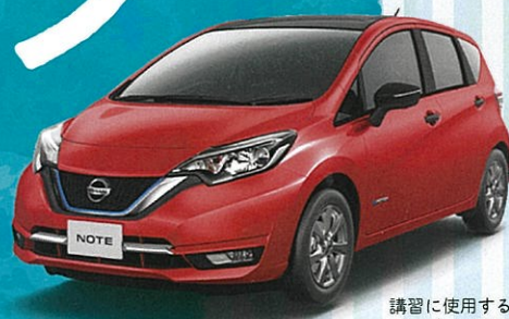
講習に使用する車両 ノート e-POWER

今回の講習では実際に道路で車を運転し、そのデータに基づいてどれだけ燃費に良い運転なのか分析した診断書を作成します。その診断書をもとに、一人ひとりにエコな運転になるアドバイスをします。