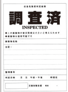
調査済(緑色) 建築物は使用可

使用の可否を3段階で判定。調査が完了した建物には判定結果を表示します(判定結果は、り災を証明するものではありません)。なお、判定士は腕章を着け、認定証を携帯しています。 建築住宅課 電話94-4783