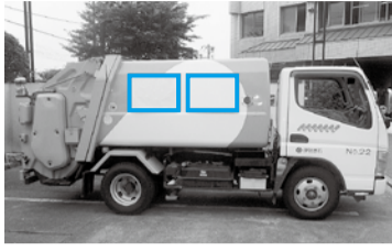
清掃車両の広告貼付位置