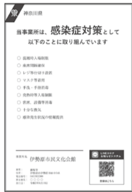
感染防止対策取組書のイメージ

◇通知はQRコードを読み取った日時に基づいて送られます。同じ場所を訪問した場合でも毎回読み取ってください