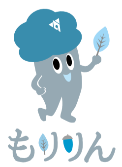
秦野市くずはの家 マスコットキャラクター「もりりん」

江戸時代、坂本(現在の大山地区)に対して西坂本とも呼ばれた養毛は、西の門前町として17軒ほどの宿坊があったとされています。また、大山講を導く御師(先導師)の里として、静岡や山梨から多くの講を招きました。 江戸初期に幕府が行った「慶長の改革」により、古くから大山を修行の場としていた僧侶や修験者らが山内を追われ、多くが麓の坂本に居住した一方、一部が養毛に移住したとされます。やがて門前町を形成し、大山寺に属する御師となった彼らは、大山信仰の普及と拡大を図るため精力的に関東各地を巡り檀家の獲得と大山講の結成を進めました。これが、のちの大山詣りブームが起こるきっかけの一つになったとされています。