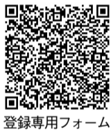
登録専用フォーム

閩県新型コロナウイルス感染症専門ダイヤル ☎0570-056-774(平日午前9時~午後5時)