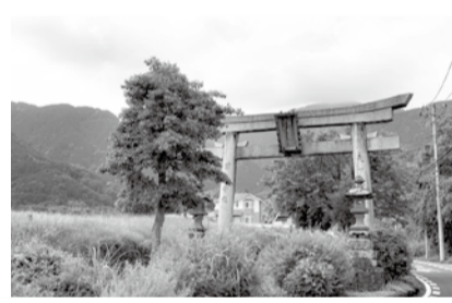
養毛入口にある大鳥居。県道の中央分離帯にあります

主要な大山道8道の最後として、南西から大山を目指す「養毛通り大山道」をたどってみたいと思います。現在の秦野市曲松で矢倉沢往還から分かれ、養毛を越えて大山へ至るルートです。 江戸からの参詣者が利用した参道に対し、小田原や伊豆、駿河などからの参詣者や富士講(富士山に参詣する集団)が西からの登山口として利用したことで知られ、養毛道や石尊道、富士浅間道という別名もあります。 ルートの途中には、養(西)の河原跡にある六地藏像や、かつての大山は男性のみ登拝が許されたことを示す女人禁制の碑などがあり、現在は「関東ふれあいの道」の一つとして整備されています。