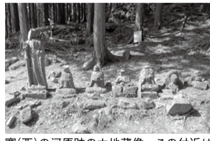
養(西)の河原跡の六地藏像。この付近は山中で罪を犯した人を処罰した場といわれています