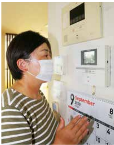
調査員は、身分を証明する「国勢調査員証」や専用の腕章、手提げ袋などを携帯しています