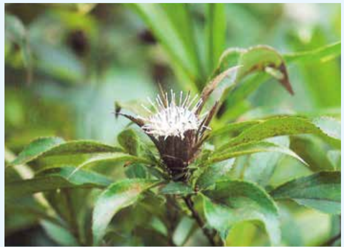
邪気を払い、胃腸などに効く生薬としても有名です