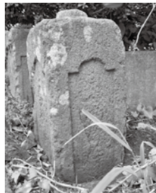
白根中央公園付近にある市内最古の道標

また、大山に向かう参道沿いには今も宿坊(先導師旅館。一般の人も食事や宿泊ができます)があり、昔ながらの白い行衣を着た大山詣りの人々が訪れます。