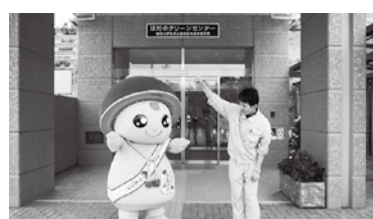
動画で学ぼう クルリンのクリーンセンター大冒険

伊勢原市と秦野市のごみ処理や斎場の運営管理を行う秦野市伊勢原市環境衛生組合が、燃やすごみの処理施設と、ごみの自己搬入方法を紹介する動画を作成しました。 クルリンが「はだのクリーンセンター」を見学してごみ処理の流れを学んだり、丹沢はだの三兄弟のぼる君とクルリンが自己搬入を体験したりと、子どもたちにも親しみやすい内容です。 担当のホームページや動画サイトYouTube「はだのいせはらクリセンチャンネル」から視聴できます。ぜひご覧ください ※右のQRコードからも視聴できます クリセンチャンネル