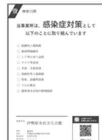
感染防止対策取組書のイメージ

☎県新型コロナウイルス感染症専門ダイヤル ☎045-285-0536(平日午前9時～午後5時)