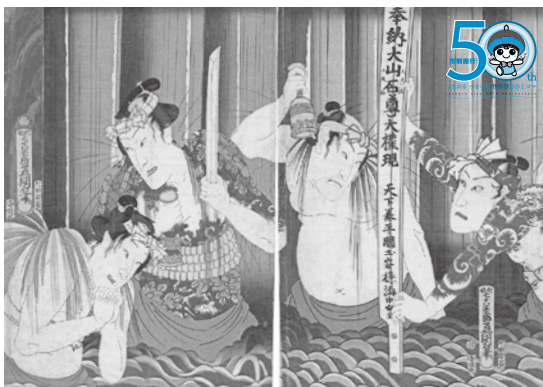
完成イメージ (原画を加工。右上に市制50周年ロゴマークが入ります)

江戸時代に盛んだった大山詣りをテーマに、参詣者のグループである「講」の人々が、木製の太刀を奉納する「納め太刀」の様子を模した浮世絵です。歌舞伎役者が扮する粋な参詣者たちが、大山の滝で身を清める場面(滝垢離)が描かれています。