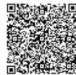
登録専用フォーム