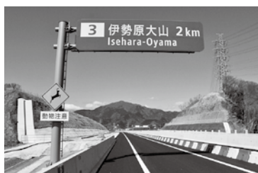
新東名高速道路から見える大山

今、本市を取り巻く「道」の状況は大きく変化しています。新東名高速道路の伊勢原ジャンクションが昨年、伊勢原大山インターチェンジが今年開通しました。さらに、圏央道や新東名高速道路と接続する厚木秦野道路(国道246号バイパス)も建設が進められています。こうした新しい交通ネットワークは、経済や文化、観光面で大きな効果が期待されます。