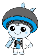
伊勢原市公式イメージキャラクター クター クルリン

市内には多くの大山道の道標があります。平成24(2012)年時点で113基が把握されており、そのうち102基について存在を確認しています。江戸時代中期に最も多く建てられており、造立年代が分かる市内最古の道標は寛文6(1666)年のものです。明治、大正時代に建てられたものもあります。そして、その多くが地元の自治会や世話役により大切に守られ、歴史を今に伝えていきます。