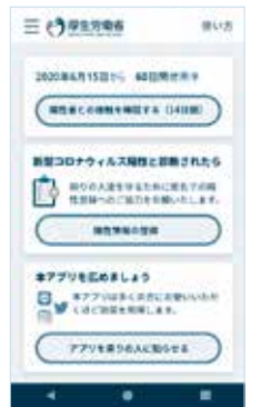
メイン画面イメージ

スマートフォンの近接通信機能(Bluetooth)を利用して、過去14日間に感染者と接触した可能性があるかを確認できます。接触が確認された場合は、画面の表示に従い症状の有無などを入力すると、検査の受診などを案内します。下のQRコードからインストールしてご利用ください。