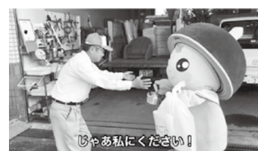
動画で学ぼう クルリンのごみ自己搬入体験