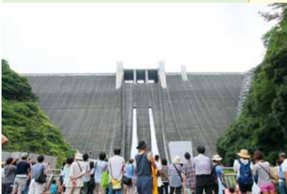
【愛川町】宮ヶ瀬ダム