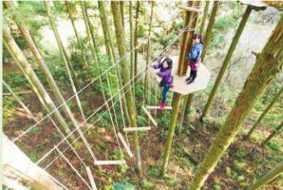
【厚木市】ツリークロスアドベンチャー