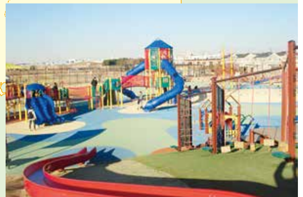
【大和市】大和ゆりの森

新型コロナウイルス感染症の影響で、私たちの生活は大きく変わりました。引き続き予防対策を心掛けながらも、まちの元気を取り戻すためには地域経済の応援が欠かせません。