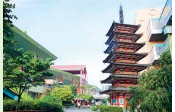
【海老名市】海老名中央公園