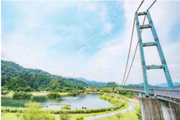
【清川村】宮ヶ瀬湖畔園地

おもな記事 ● 2面…伊勢原市長選挙の結果 ● 4面…ご当地キャラが行く！ 近場+小旅行=となりっぷ ● 5面…危機を知り、安全に動く 発行部数/39,700部