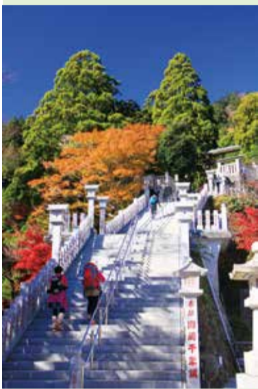
【伊勢原市】大山阿夫利神社