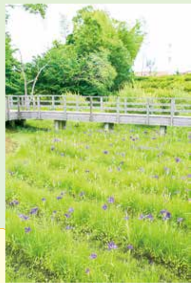
【綾瀬市】蟹ヶ谷公園