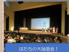
はたちの大抽選会！

1月13日(月)、1月とは思えない暖かく穏やかな青空の下、今年度はたちを迎える728名が式典に参加しました。