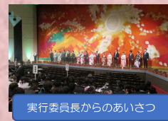
実行委員長からのあいさつ