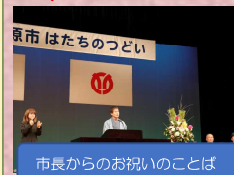
市長からのお祝いのことば