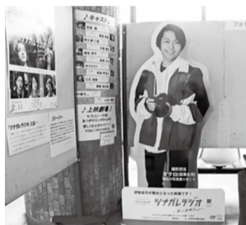
市役所1階ロビーの様子