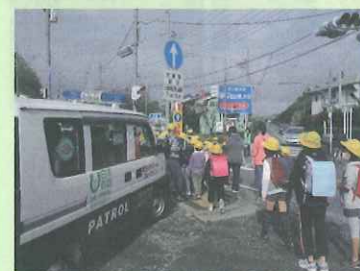
神奈川県内では、457団体、1,583台の青パト車両が活躍中です(令和2年末現在)

青パトは市区町村職員のほか、自治会・町内会などに所属する一般の方も多く活動しています。実際に、県内で活躍中の青パト実施者のうち、約6割が自治会などの地域住民の皆さんです。青パトに使用する車両は、パトカーのような専用車両をはじめ、条件を満たせばお持ちの自家用車も使用可能です。