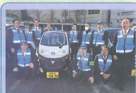
今回写真を提供していただいた、「特定非営利活動法人防犯パトロールブルーライン」の皆さんです。神奈川県厚木市・愛川町・清川村において、通学路の見守りや特殊詐欺への注意喚起等を目的とした青色防犯パトロール活動を日々行っています!

警察への申請や講習の受講に料金はかかりませんが、青色回転灯本体の購入や、車体に団体名などを表示するためのマグネットシートなどの購入が必要なほか、燃料費など車両の維持費も必要となります。上記のような防犯活動にかかる費用に対して補助を行っている自治体もありますので、お住まいの地域の市区町村にご確認ください。