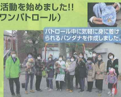
パトロール中に気軽に身に着けられるバンダナを作成しました。

本牧元町北部町内会では「本牧ワンワンパトロール」を結成し、町内会と子供会を中心としたメンバー11人が活動を開始しました。これからも、楽しく気軽に活動へ参加していきたいと思えます。