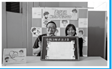
記念撮影用のバックボードも設置しています

本庁舎内で撮影が行われたテレビドラマ「逃げるは恥だが役に立つ」で主演を務めた星野源さんと新垣結衣さんの結婚を祝い、6月中に婚姻届を提出された人に特別仕様のお祝いカードを差し上げています。