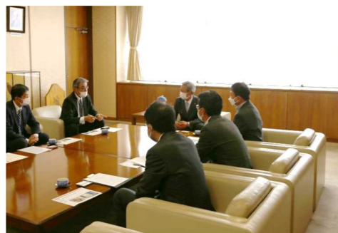
伊勢原市企業版ふるさと納税感謝状贈呈式 株式会社がんこ茶家 様