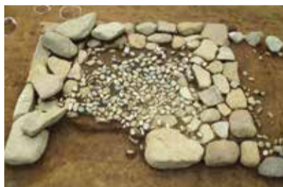
子易・中川原遺跡 石組墓(鎌倉時代)

西富岡・向畑遺跡や東大竹・上谷戸遺跡第4地点、子易・中川原遺跡など、市内で行われている発掘調査の成果を、出土資料や写真パネルで展示します◇2月16日よりオンラインでも紹介します。詳しくは市ホームページ「いせはら文化財サイト」をご覧ください